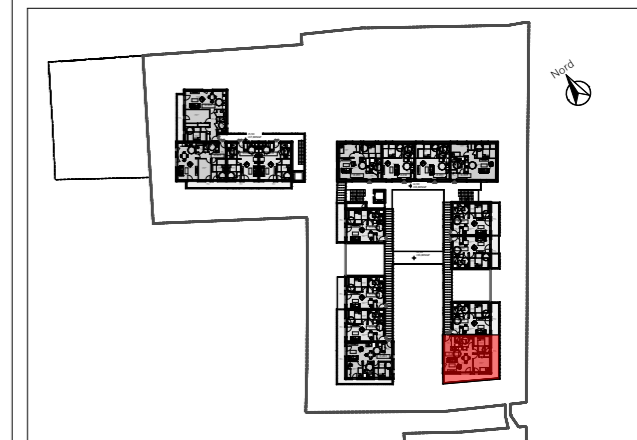
APPARTEMENT B204 - T3 2ème étage

Résidence Séniors 1-5 rue Albert Lépée Saint-Pierre-en-Auge